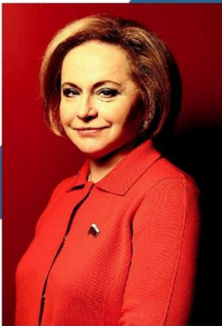
Любовь Николаевна Духанина, заместитель председателя Комитета по образованию и науке ГД РФ, член Центрального штаба ОНФ, координатор проекта «Равные возможности – детям»